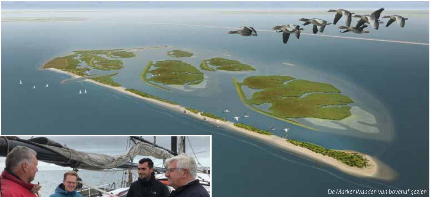
De Marker Wadden van bovenaf gezien