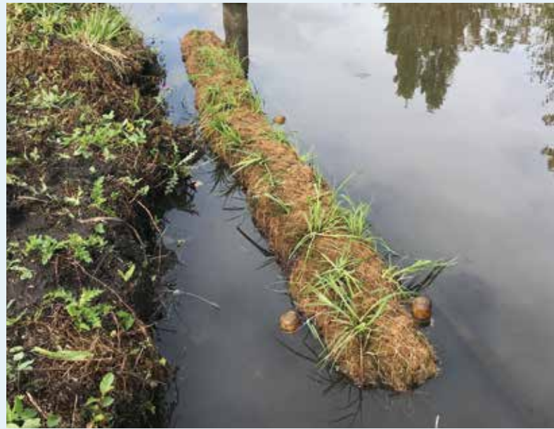
Cocosrollen met oeverplanten Baardsekker