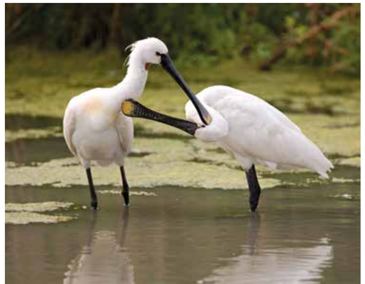
Lepelaars in de Marker Wadden

Wilt u onze digitale nieuwsbrieven ontvangen en zo nog sneller op de hoogte zijn van het laatste nieuws?