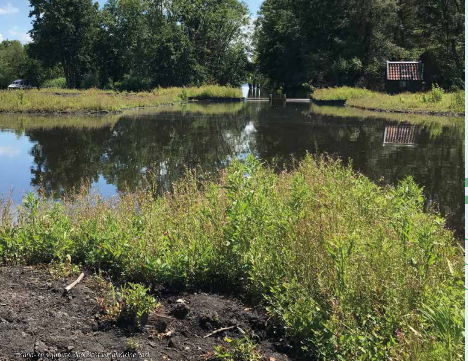
Kano- en suproute, doorzicht vanaf Kleine Poel