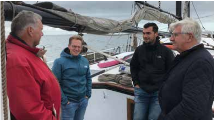
Een goed gesprek op het veer naar de Marker Wadden