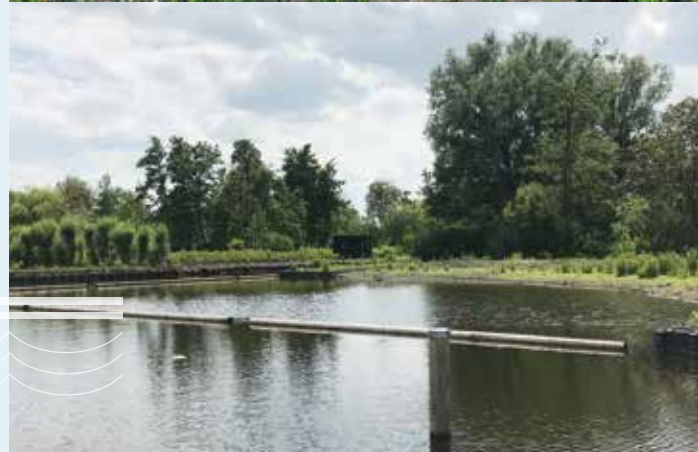
Nieuw poeltje in Grote Brug Akker