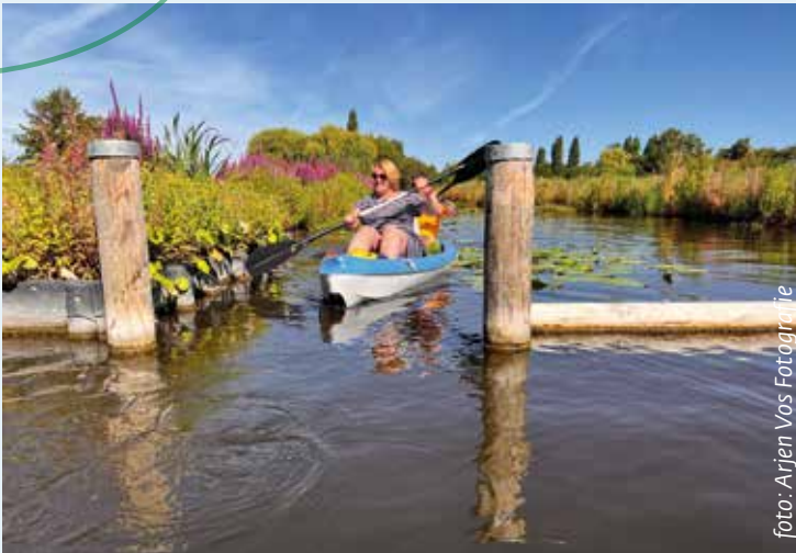
Genieten van kano- en suproute.

Er zijn nieuwe biotopen aangelegd voor onderwaterleven (natuurvriendelijk oevers en stille, ondiepe poelen) en voor bovenwaterleven (sterk variërende, natuurlijke aanplant) en er is een eerste aanzet gemaakt voor een scheiding tussen vrij toegankelijk doorvaarten en uitsluitend per kano of sup bereikbare slootjes dieper de natuur in. Waar nodig zijn zichtbare en soms ook niet zichtbare oeverbeschermingen aangebracht in de vorm van onderwaterbeschoeiing, drijfpalen en luwteschermen.